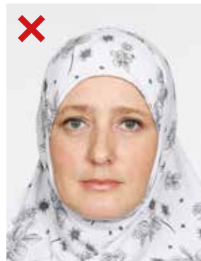
FEIL: Ørene synes ikke.