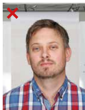
FEIL: Ujevn bakgrunn. For langt unna.