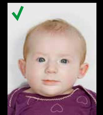
KORREKT: Samme krav for barn som for voksne.