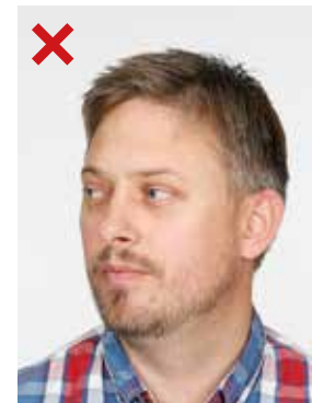
FEIL: Hode og blikk er vendt fra kamera.