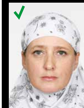
UNNTAK: Bruk av hodeplagg*. Ansikt og ører er synlig.