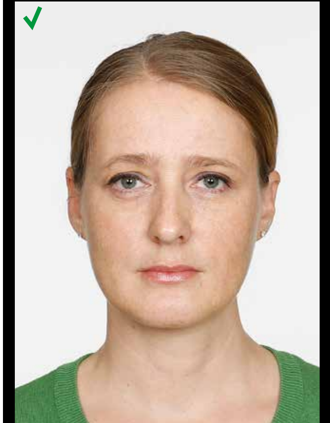
KORREKT: Nøytralt uttrykk, rett forfra, ser inn i kamera. Verken briller, hår eller hodeplagg forstyrrer. Hodet dekker ca 70 % av bildet.