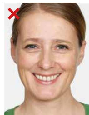
FEIL: Munnen er åpen. Hele hode synes ikke.