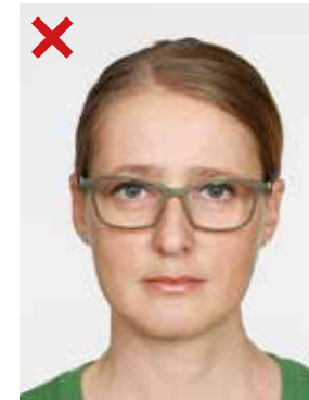
FEIL: Brillen skal ikke brukes.