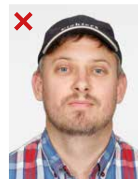
FEIL: Hodeplagg skal ikke brukes*.