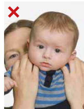
FEIL: Urolig bakgrunn.