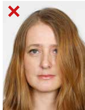
FEIL: Hår dekker ører og delvis øyne.

* Personer kan av religiøse eller andre særskilte grunner, for eksempel ved sykdom, bruke hodeplagg på fotografiet når det er grunn til å anta at vedkommende vil bruke tilsvarende hodeplagg i fremtidige kontroller. Hodeplagget må ikke tildekke noe av ansiktet eller mer av hodet enn det som er nødvendig. Begge ørene skal være synlige.