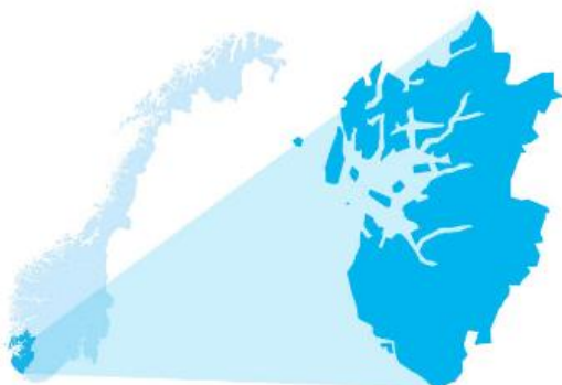
Utsnitt av Sør-vest politidistrikt.

Hatkriminalitetssaker ble registrert i alle de fem geografiske driftsenhetene i politidistriktet