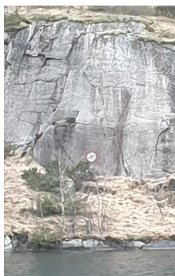
Bilde 3: Hakekorset er malt på fjellet ved Glppedalsura.

Eller som bildet under viser hvor hakekorset er malt på fjellet ved Glppedalsura i Gjesdal.