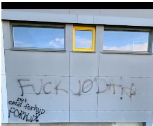
Bilde 1: Tagging på en bygning med teksten: "Fuck jøder. Det er min forhud" i 2021.

Bildet under viser et skadeverk fra 2021, Også i 2020 var flertallet av skadeverkene relatert til antisemittisme (to anmeldelser), mens det tredje var knyttet til religionen islam (en anmeldelse).